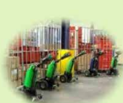
Логистика и склад