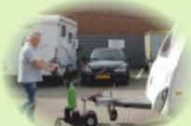
Перемещение прицепов и трейлеров