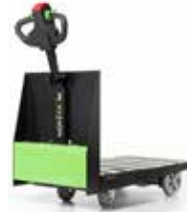
P300 600 x 1000