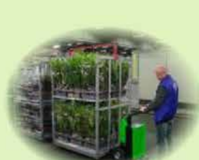
Сельское и подсобное хозяйство