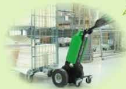
Клининговые компании и уборка