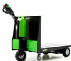
P300 800 x 1200