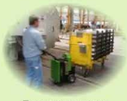
Промышленность и производство