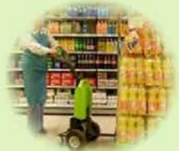
Супермаркеты и ритейл